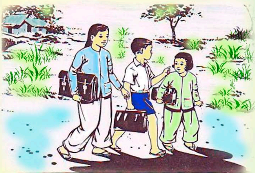
chi, tí, tơ đi học