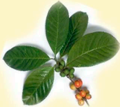
lá cà phê