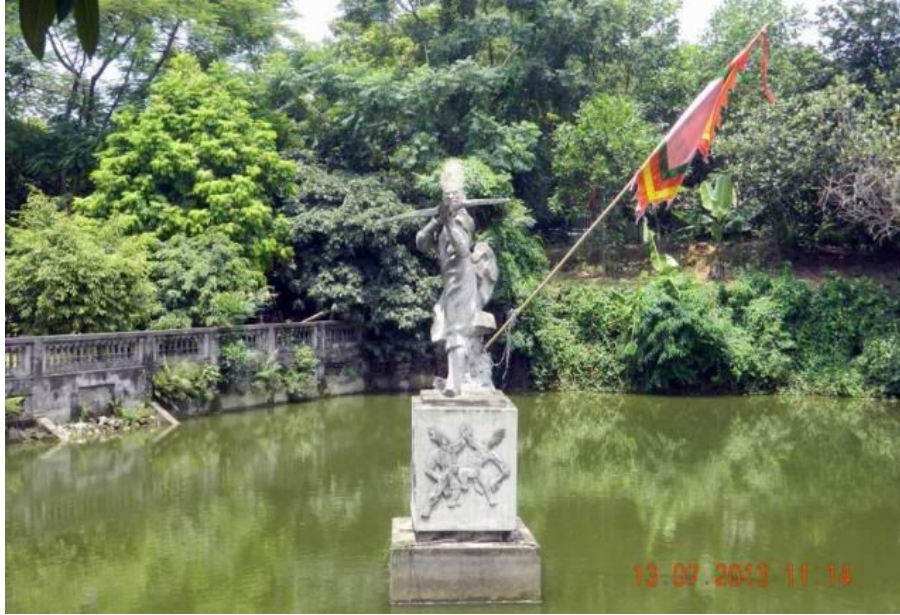
Hình tượng tướng Cao Lỗ ở giữa hồ, tay dương nỏ Liên Châu.

Cao Lỗ (? - 179 trước Công nguyên) (còn gọi là Cao Nỗ, Cao Thông, Đô Lỗ, Thạch Thần, hay Đại Than Đô Lỗ Thạch Thần) là một tướng tài của Thục Phán An Dương Vương, quê quán tại xã Cao Đức, huyện Gia Bình, tỉnh Bắc Ninh ngày nay.