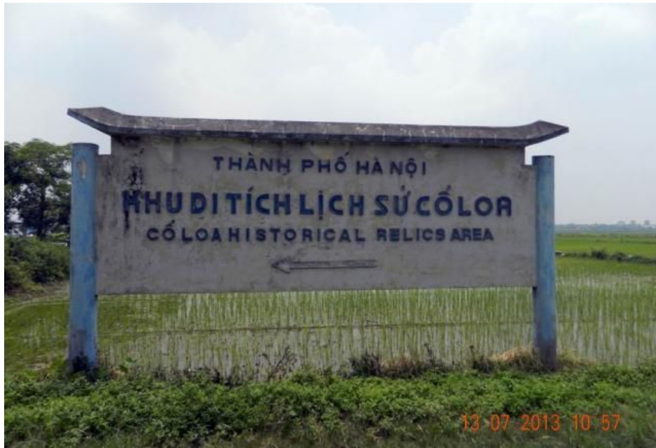
Hình hướng dẫn du khách vào thành Cổ Loa ở Đông Anh.

Xin giới thiệu di tích thành Cổ Loa ở Đông Anh - Hà Nội.