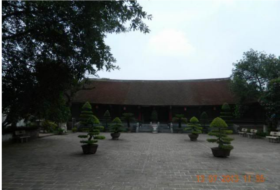
Cung điện là một tòa nhà 9 căn, cửa đóng then gài vì quá trưa không mở cửa.