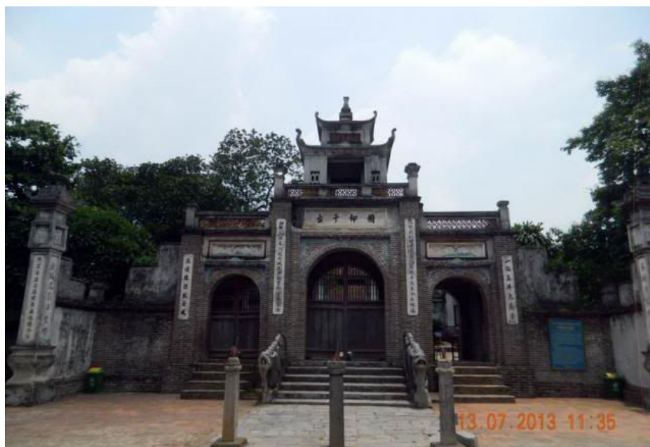
Cổng chính của đền thờ vua nhìn ra hồ nước.