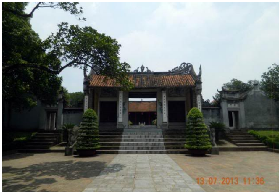
Qua cổng chính là cổng Tam Quan.