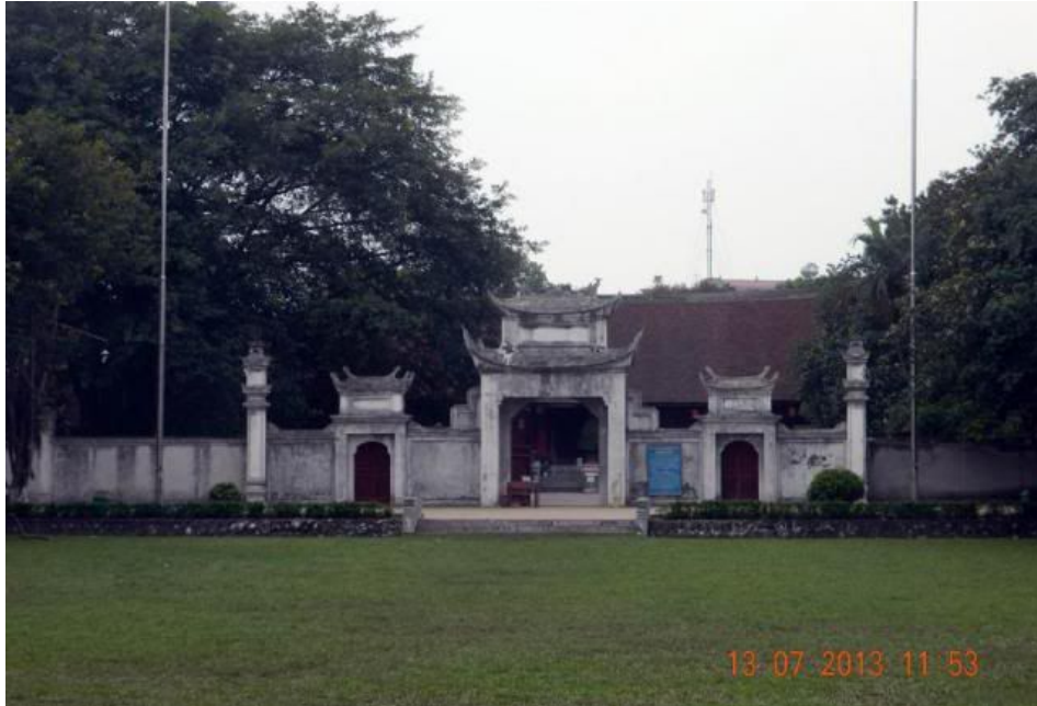
Dù đã trưa nhưng vẫn tiếp tục quay lại đền Cao Lỗ, phía sau đền Cao Lỗ là cung đình, nơi hội họp của An Dương Vương.