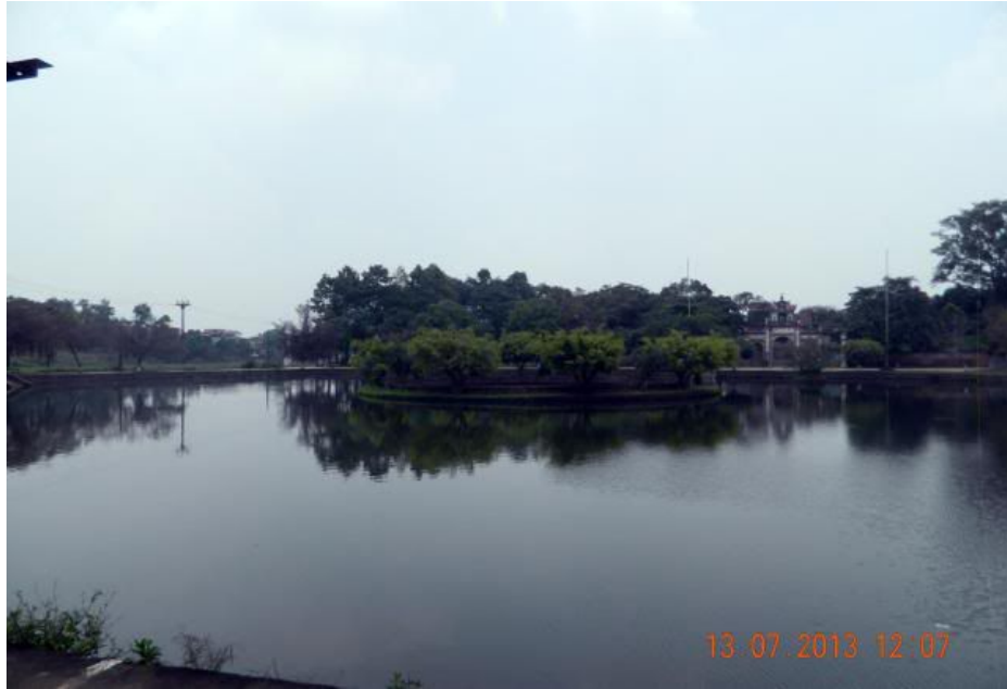
Góc xa nhìn về ngôi đền thờ vua.