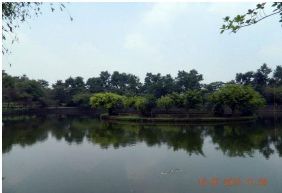
Hồ nước trước đền thờ, một phong cảnh hữu tình nhất của thành Cổ Loa.