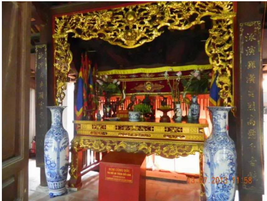
Án thờ Hội đồng.