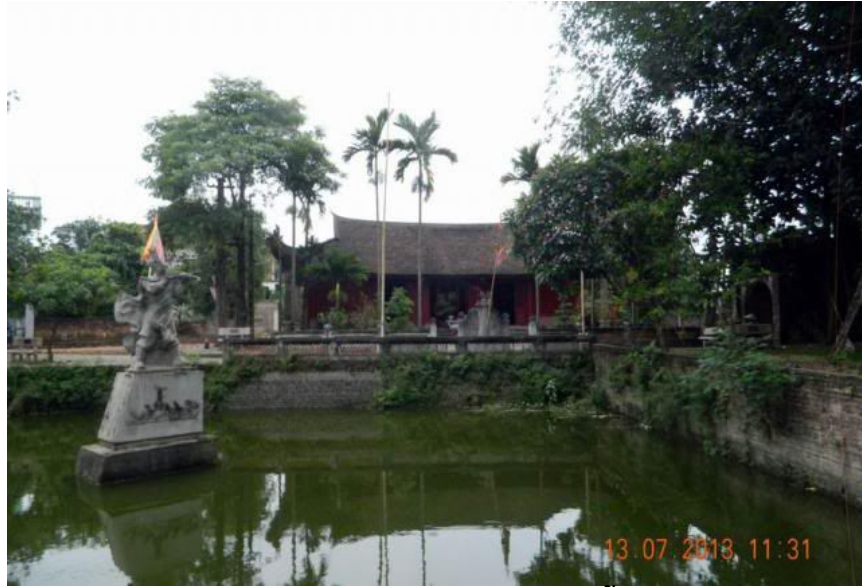
Toàn cảnh đền thờ Cao Lỗ.