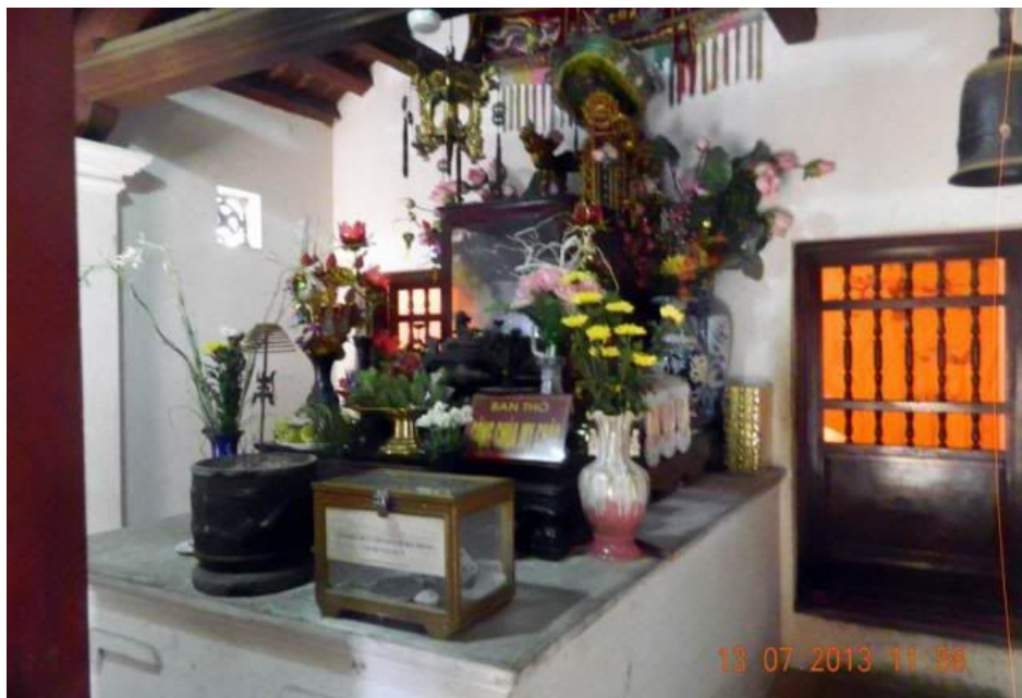
Án thờ My Nương ở Hậu cung, nơi đây âm u thấy rợn người khi lên vào chụp ảnh.