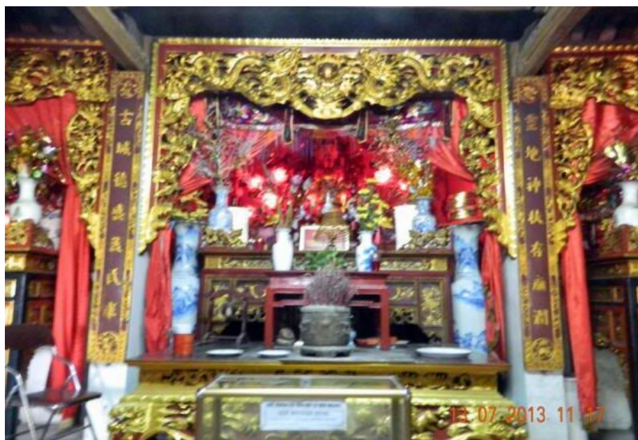
Án thờ Cao Lỗ ở Hậu cung.