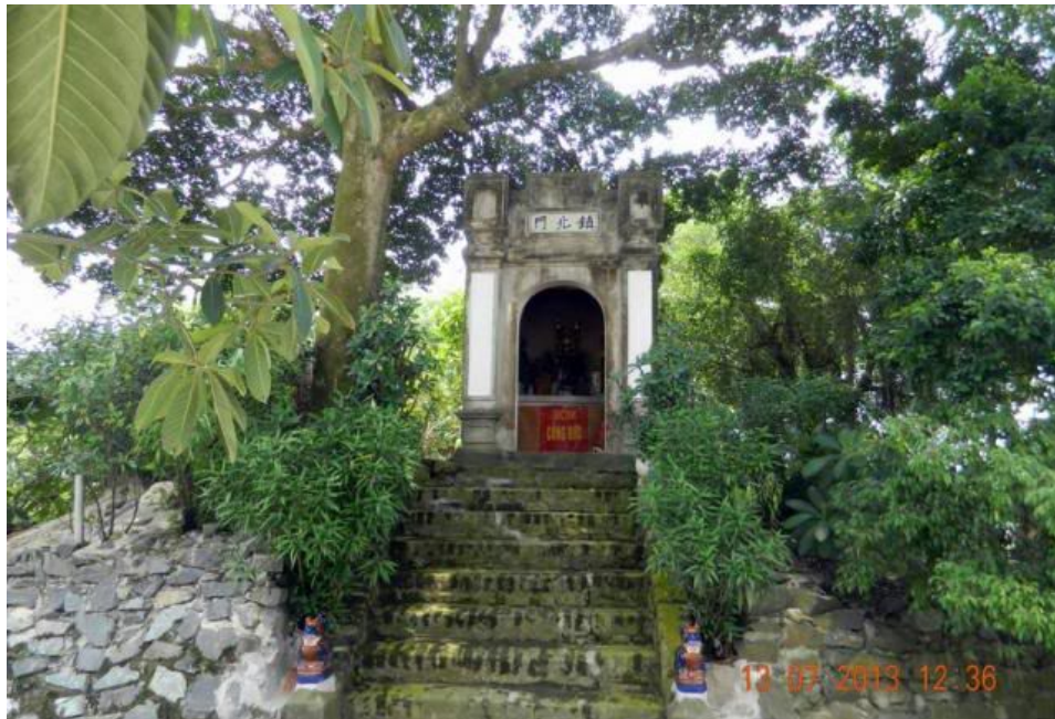
Cửa Trấn Bắc