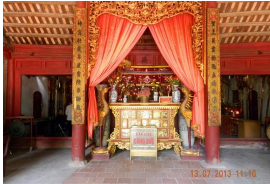
Án thờ tiên sảng, thờ Bách gia trăm họ.