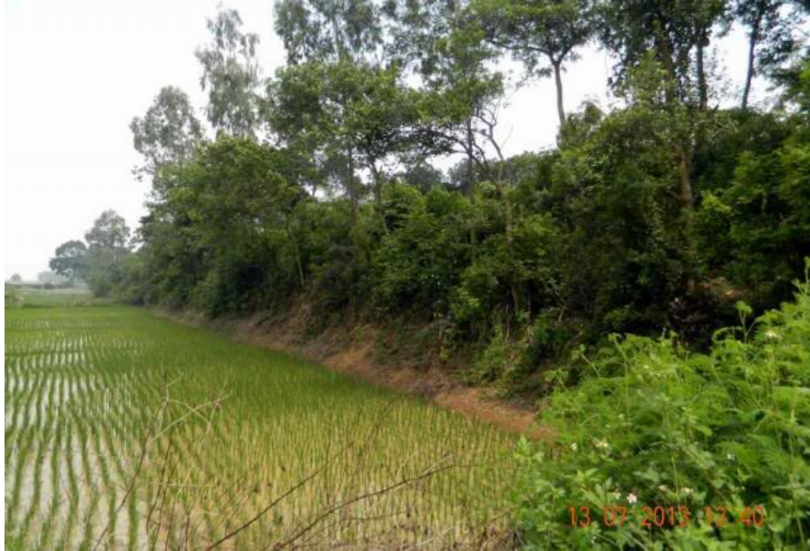
Vòng thành bị đứt nhiều đoạn. Cứ thấy giữa cánh đồng có đoạn nào cao, cây cối mọc sum sê thì đó là đoạn thành Cổ Loa.