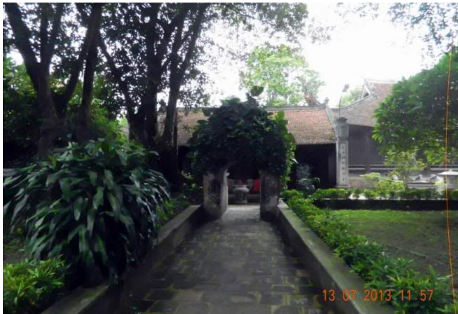
Bên cạnh là miếu thờ Mỹ Nương.