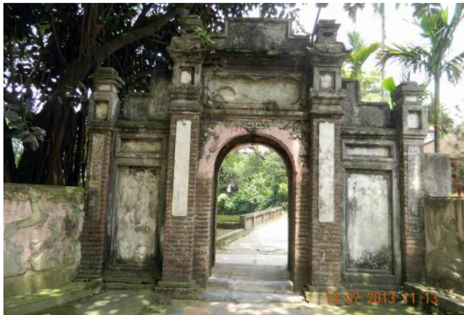
Qua cửa Trấn Nam rẽ tay phải đến khu di tích đền thờ tướng Cao Lỗ.