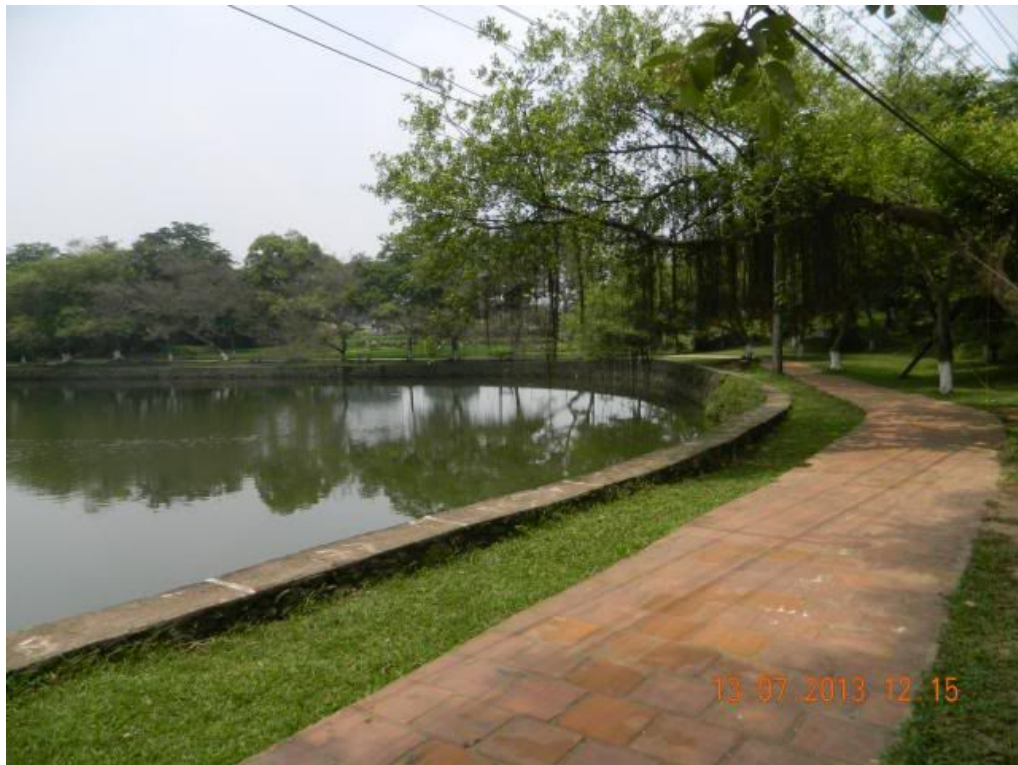
Một cảnh của hồ nước trước trước đền thờ rất thơ mộng.