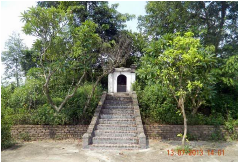
Cửa Trấn Tây. Riêng cửa Trấn Đông không còn vì người dân nơi đó đã san bằng để xây dựng nhà cửa. Thật đáng tiếc.