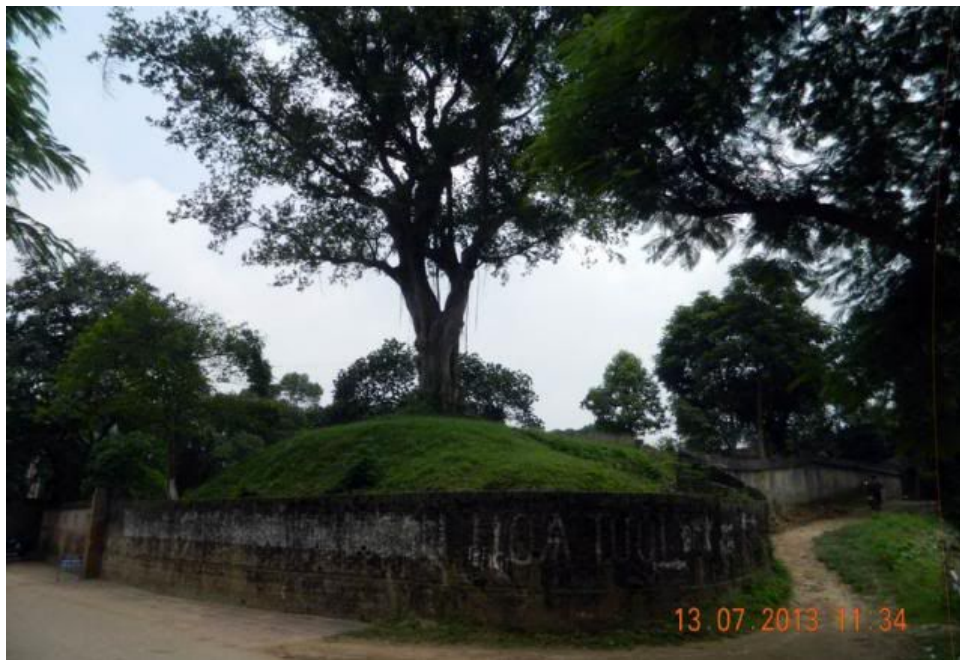
Đền thờ Vua An Dương Vương cách đền thờ Cao Lỗ chừng 150m