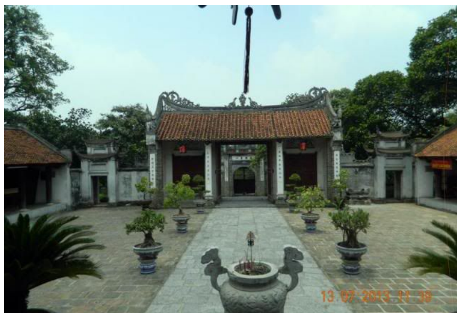
Hình ảnh nhìn từ chánh điện ra phía trước, thiết kế gong gàng, hai bên là hai nhà tả, hữu. Buổi trưa hết giờ hành chánh cửa điện đóng nên không vào bên trong điện được