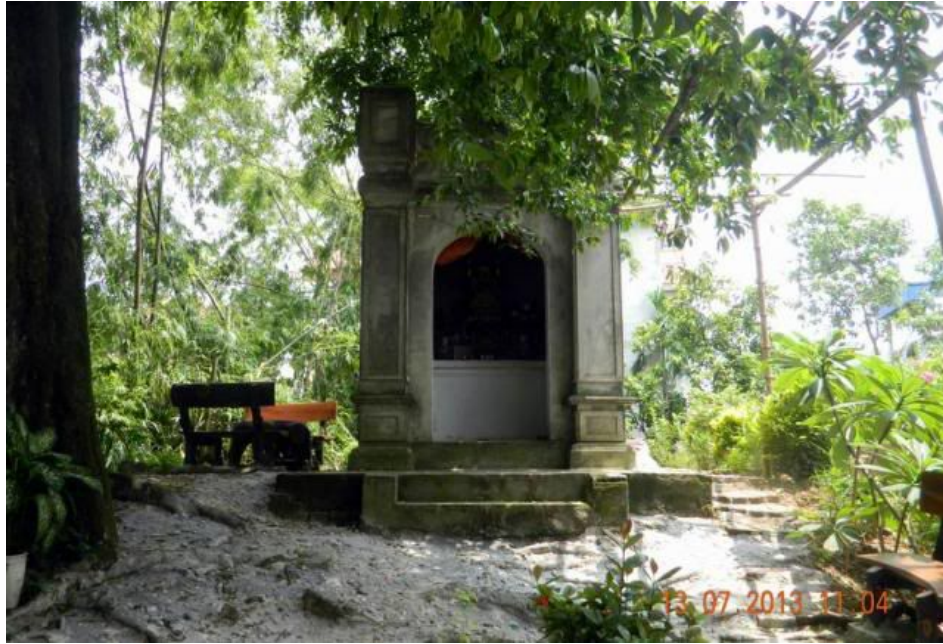
Miếu thờ thần trấn cửa Nam. Thành Cổ Loa có 4 miếu trấn 4 hướng Đông - Tây - Nam - Bắc.