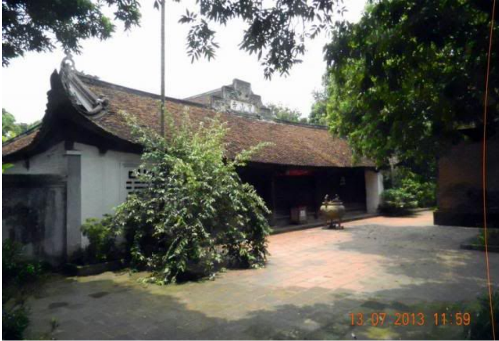
Một góc nhìn về chánh điện.