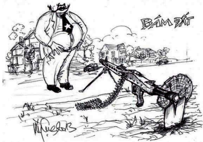
Bám đất (Kỳ Cục - Danchimviet.info)

Việc đàn áp dữ dội năm 2008 đối với Giáo phận Công giáo Hà Nội trong vụ Tòa Khâm sứ và đối với Dòng Chúa Cứu Thế trong vụ Thái Hà, mới đây là đối với Giáo phận Công giáo Vinh trong vụ Mỹ Yên (thậm chí Ban Tôn giáo chính phủ đã phải cấp thời sang Vatican từ ngày 15 đến 20-09 để yêu cầu Tòa thánh trừng phạt Giáo phận này và trừng phạt cả Dòng Chúa Cứu Thế). Rồi bao nhiêu cuộc đàn áp đối với các Giáo hội chính truyền khác tại VN mấy thập niên qua, tất cả đều xuất phát từ chỗ nhà cầm quyền thấy các Giáo hội này (cùng với những tổ chức trực thuộc bên trong) đều là những xã hội dân sự đúng nghĩa, vì các thành viên liên kết chặt chẽ với nhau bởi những mục tiêu cao cả, họ lại luôn độc lập cách nào đó với nhà cầm quyền (dù nhà cầm quyền tìm cách khống chế và kiểm soát họ qua Pháp lệnh lẩn Nghi định tôn giáo), luôn phê phán nhà cầm quyền trực tiếp hoặc gián tiếp qua việc đòi hỏi tự do tôn giáo và tranh đấu cho nhân quyền dân chủ. BAN BT