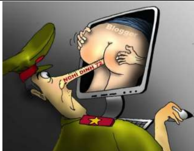
Nhiệt kế và cơn sốt internet (Babui - Danchimviet.info)